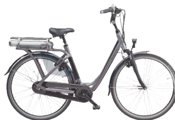
Sparta M8e RT